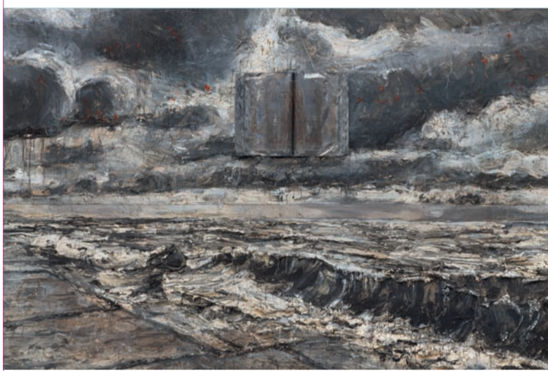
ANSELM KIEFER, Nur mit Wind mit Zeit und mit Klang, 2011, Foto: Ulrich Ghezzi courtesy Galerie Thaddaeus Ropac Paris - Salzburg, © Anselm Kiefer