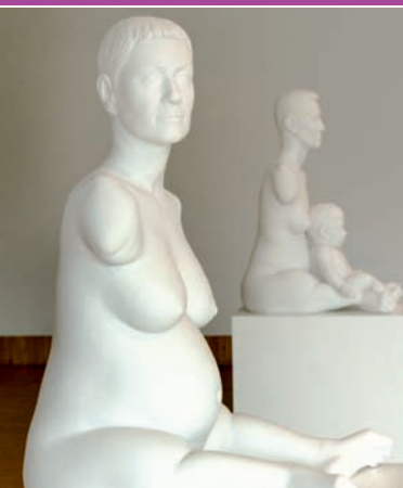
SCHÖNHEIT UND VERGÄNGLICHKEIT, 2011