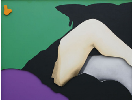
John Baldessari: Arms & Legs (Specif. Elbows and Knees), etc.: Knees (with Nose), 2007 © John Baldessari