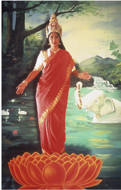
Pushpamala N.: Lakshmi (from "Native Types" series), 2000 – 2004