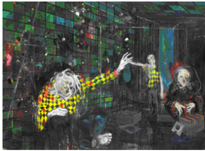
Daniel Richter: Elektro/a, 2005 © VBK, Wien, 2009