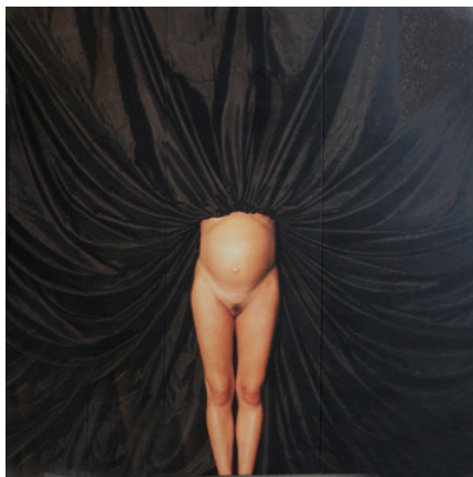
Cornelius Kolig: Umstandskleid, 1999 © Cornelius Kolig, 1999

Anfang der 60er Jahre steht Schilling in engstem Kontakt mit Günter Brus und entwickelt eine extrem gestische, informelle Malerei. 1962 entstehen in Paris motorisierte Rotations- und Schleuderbilder. Schilling entwickelt darin seine Idee des Bewegungsbildes weiter: er malt, schüttet und schleudert Farbe auf rotierende kreisförmige Bildflächen von über 2 m Durchmesser. Schon in den rotierenden Scheibenbildern ist Schillings Interesse zu erkennen, Bewegungs- und Raumerfahrungen zu kombinieren. Schilling setzt sich intensiv mit Blick, Bewegung und Dreidimensionalität auseinander, er experimentiert mit Hologrammen und Linsenrasterfotografie. Parallel dazu arbeitet er an „Sehmaschinen“ (Apparaturen zur visuellen Manipulation des Raumes) und autobinären Raumbildern, die sich durch Betrachten mit dem Prisma-Monokel in den dreidimensionalen Raum öffnen.