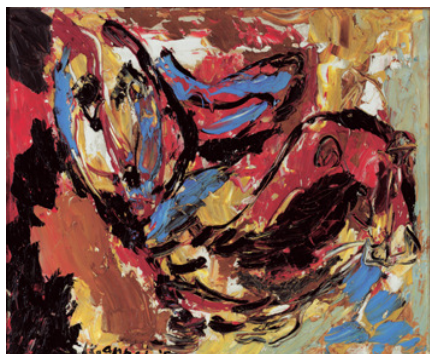
Karel Appel: Two Heads, 1957 © Karel Appel Foundation, Amsterdam